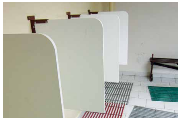
místnosti pro provádění důkladných osobních prohlídek