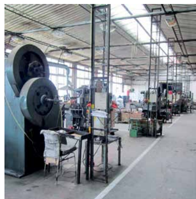
příklad pracoviště odsouzených v areálu věznice

Za zaměstnané lze považovat ty odsouzené, kteří jsou reálně zaměstnaní, nebo i ty, kteří se účastní vzdělávacích, terapeutických programů či vykonávají práce pro zajištění chodu věznice bez nároku na pracovní odměnu. Podíl zaměstnaných odsouzených lze pak vztahovat buďto ke kmenovému stavu věznice (tedy všichni odsouzení) anebo pouze k těm, kteří jsou zaměstnatelní (práce schopní). Lze takto vyřadit z výpočtu některé skupiny vězňů a to z nejrůznějších důvodů – ti, kteří odmítli pracovat (kterých je však minimum – 20 vězňů 45 ve všech věznicích); ti, kteří jsou v nástupním oddělení, ti, jejichž zdravotní stav jim neumožňuje trvale pracovat; ti, u kterých existují právní či bezpečnostní důvody pro nezařazení do práce; ti, kteří jsou v ochranné léčbě; ti, kteří jsou starší 65 let; ti, kteří jsou plně invalidní; další, o kterých tak stanoví řád výkonu trestu, respektive jsou podle něj vyňati z povinnosti pracovat. Poměrně zásadní je tedy věnovat pozornost metodice výpočtu zaměstnanosti.