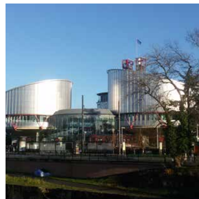
budova ESLP ve Štrasburku

Ve vztahu k materiálním podmínkám osob se zdravotním postižením ESLP zdůrazňuje, že státy musí přijmout přiměřené úpravy a odstranit všechny překážky v prostředí, které těmto osobám znemožňují integraci mezi ostatní spoluodsouzené, a v maximální možné míře tak zajistit jejich fyzickou a psychickou integritu, posílit jejich autonomii a zabránit jejich další stigmatizaci. 91 Musí tak zejména být odstraněny všechny stavebně technické překážky, které daným osobám znemožňují samostatný pohyb v částech věznice, kde by jinak byli oprávněni se pohybovat. 92 Zvláštní důraz ESLP s ohledem na respekt k důstojnosti člověka klade na zajištění samostatného přístupu a technického uzpůsobení toalet a umýváren, aby osoby s fyzickým postižením, jsou-li toho schopny, mohly tyto intimní úkony vykonávat samostatně bez pomoci třetích osob. Zároveň je stát povinen umožnit těmto osobám, trpí-li inkontinencí, přístup do sprch denně. 93