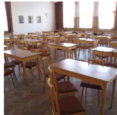
příklad „restauračního“ uspořádání návštěvní místnosti

Osobně považuji za vhodnější tzv. restaurační uspořádání návštěvních místností (tzn. samostatné stoly). Kontrolu a prevenci předávání návykových látek je vhodno provádět prostřednictvím kamerových systémů, nikoliv omezováním soukromí při návštěvách či omezováním kontaktů odsouzených s návštěvami.