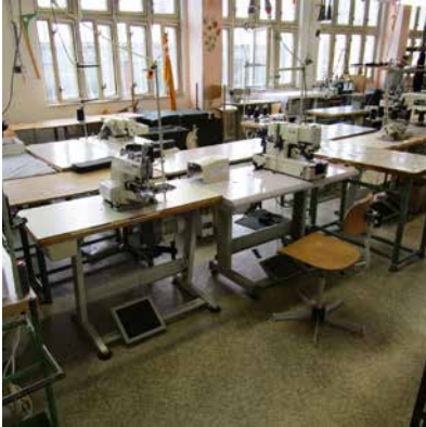
pracoviště odsouzených – šicí dílna

o výši a podmínkách odměňování odsouzených osob zařazených do zaměstnání ve výkonu trestu odnětí svobody).