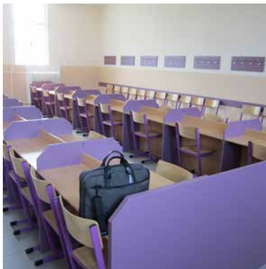
příklad liniového uspořádání návštěvních místností

V některých věznicích byly stoly v návštěvních místnostech uspořádány liniově, v důsledku čehož bylo minimalizováno soukromí při návštěvách, odsouzení a jejich návštěvy se vzájemně rušili.