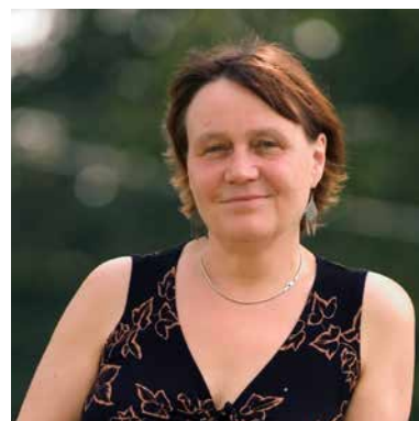
Mgr. Anna Šabatová, Ph.D. veřejná ochránkyně práv

Již od roku 2001 veřejný ochránce práv navštěvuje věznice a řeší podněty týkající se podmínek výkonu vazby či trestu odnětí svobody a postupu Vězeňské služby ČR. Posledních deset let rovněž vykonává preventivní systematické návštěvy ve smyslu Opčního protokolu k Úmluvě proti mučení. Za tu dobu vydal několik významnějších zpráv z oblasti vězeňství. Jde zejména o zprávu z návštěv věznic z roku 2006, v níž shrnul poznatky z návštěv věznic s ostrahou a zvýšenou ostrahou a zprávu z návštěv vazebních věznic z dubna 2010. Významnou publikací je také sborník stanovisek Vězeňství publikovaný v roce 2010. Již tehdy JUDr. Otakar Motejl v předmluvě doporučil, aby o přeřazování odsouzených do jednotlivých typů věznic namísto soudů rozhodovala přímo Vězeňská služba ČR. Neočekával, že by se jeho myšlenka mohla naplnit dříve než za několik let, považoval však za nutné ji znovu, a možná naléhavěji zopakovat. K návrhu prvního ombudsmana se připojuji.