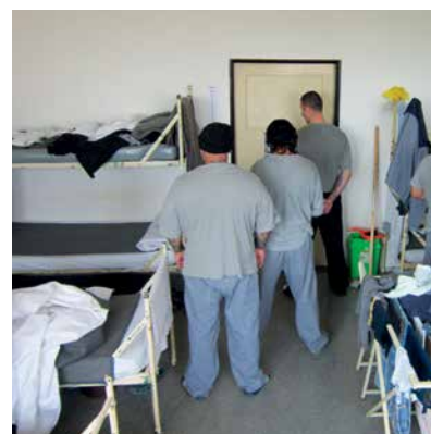
příklad hromadného ubytování